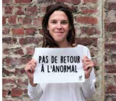
Campagne justice fiscale CNCD 11.11.11

La période que nous traversons est, pour chacune et chacun d'entre nous, un événement inédit qui suscite à la fois craintes et espoirs. Chez Justice et Paix, nous n'avons cessé de nous adapter et de nous réinventer car nous croyons en notre capacité collective de forcer le destin et d'inventer pour nos sociétés un futur désiré et désirable.