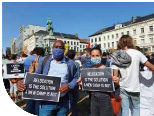
Rassemblement SOS Moria #leaveneonebehind

Pour le meilleur et pour le pire, 2020 est l'année qui nous a toutes et tous changé-es à jamais. Une année qui nous a sans cesse forcé-es à nous adapter, à ralentir, à nous questionner et à nous réinventer. La crise sanitaire a révélé d'importantes fractures sociales et exacerbé des inégalités humaines fortes et inacceptables. Mais cette crise, aussi dramatique soit-elle, doit être vue comme une réelle