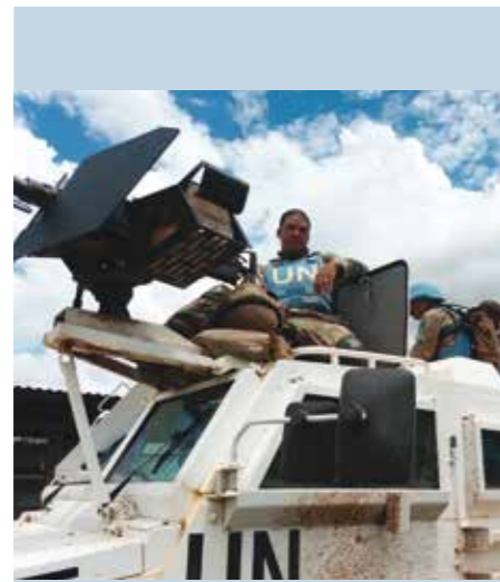
Depuis 1999, les casques bleus des Nations-Unies sont présents à l'Est du pays en raison des nombreux conflits armés qui sévissent dans la région.

Plus de 70 groupes armés sont actifs aujourd'hui en RD Congo. On constate que les lieux où ils sont présents sont quasiment identiques à ceux où se trouvent les ressources minières. Cette superposition nous permet d'établir le lien entre le maintien de leur présence et le commerce des minerais.